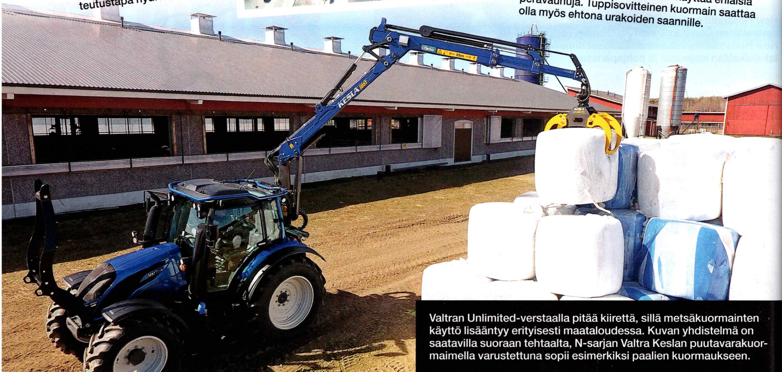
Valtran Unlimited-verstaalla pitää kiirettä, sillä metsäkuormainten käyttö lisääntyy erityisesti maataloudessa. Kuvan yhdistelmä on saatavilla suoraan tehtaalta, N-sarjan Valtra Keslan puutavarakuormaimella varustettuna sopii esimerkiksi paalien kuormaukseen.