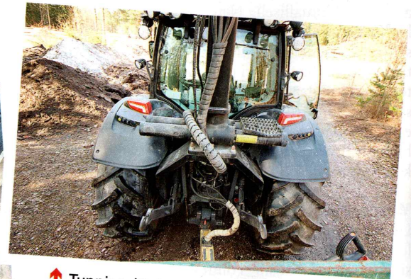
↑ Tuppisovitteinen kuormain soveltuu niin metsä- kuin kunnallistekniseen käyttöönkin. Traktorin perässä voidaan joustavasti käyttää erilaisia perävaunuja. Tuppisovitteinen kuormain saattaa olla myös ehtona urakoiden saannille.