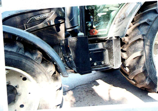
↓ Jake valmistaa esimerkiksi nelosarjan N-Valtroihin teräksisiä polttoaine- ja ureasäiliöitä.