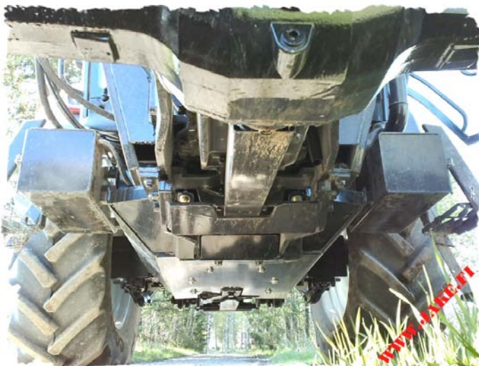
JAKE Metsätankki ilman Moottorin Panssaria