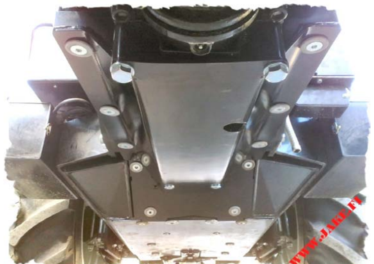
JAKE Metsätankki Moottorin Panssarin kanssa