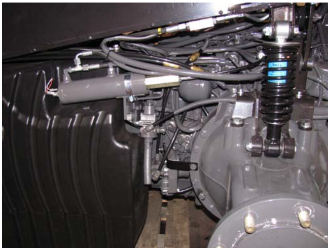
HiTec – Versu – Direct