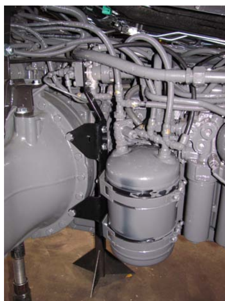
Versu – Direct