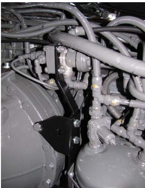
Versu – Direct